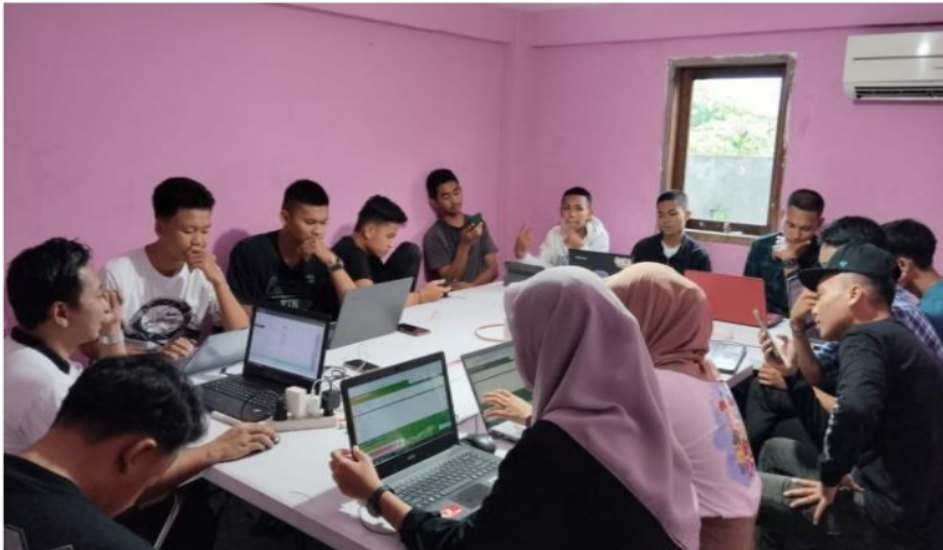
Gambar 3. Simulasi Ujian Peserta Pelatihan (Kantor BIBIT Parepare Kelas B sebanyak 14 peserta, Jum'at, 29 Maret 2024)

Setelah peserta melaksanakan simulasi ujian, peserta diminta untuk mengisi angket setelah pelatihan sebagai alat evaluasi untuk mengukur keefektifan pelatihan. Tujuannya adalah memberikan penilaian langsung terhadap pelaksanaan pelatihan. Berikut hasil respons peserta setelah pelatihan.