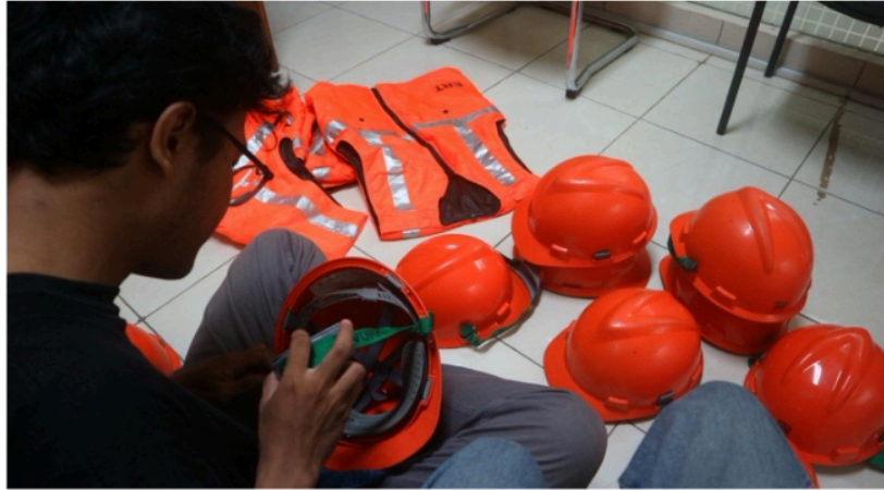
Gambar 1. Tim mempersiapkan APD (Alat Pengaman Diri)

Pendekatan yang digunakan dalam kegiatan ini merupakan kombinasi dari metode pelatihan ipteks terbarukan, peningkatan pemahaman masyarakat terhadap sistem energi alternatif, serta pendampingan intensif dalam pengembangan kelompok usaha. Model pelaksanaan ini diharapkan dapat direplikasi di wilayah lain dengan kondisi serupa.