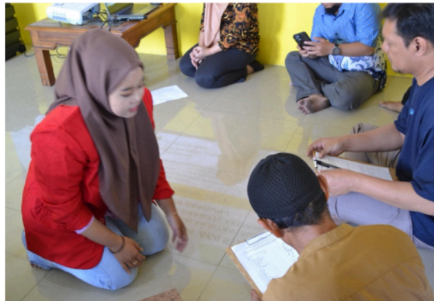
Gambar 3. Tim pelaksana mendampingi peserta pelatihan dalam pengisian kuesioner

Simulasi troubleshooting yang dilakukan dengan skenario kerusakan umum—seperti kabel terputus, baterai lemah, dan gangguan panel—memperlihatkan bahwa peserta mampu menerapkan pengetahuan peserta dalam konteks nyata. Beberapa peserta bahkan menunjukkan inisiatif untuk memodifikasi sambungan dan menguji efisiensi energi dengan alat pengukur sederhana. Temuan ini menguatkan pandangan bahwa pendekatan pelatihan langsung berbasis praktik lapangan sangat efektif dalam meningkatkan pemahaman masyarakat terhadap teknologi tepat guna di tingkat komunitas 10 .