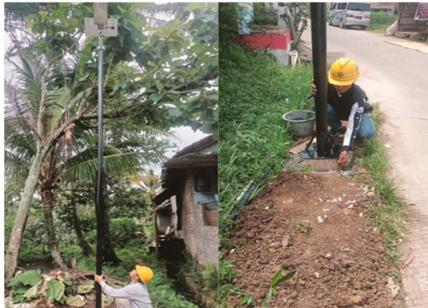
Gambar 4. Peserta melaksanakan praktik di lapangan

Respons dari mitra sasaran sangat positif, dalam wawancara akhir, 90% peserta menyatakan pelatihan ini bermanfaat dan ingin dilanjutkan ke tingkat yang lebih tinggi. Pihak desa juga menyatakan komitmennya untuk menjadikan kelompok yang terbentuk sebagai mitra tetap dalam program desa berbasis energi terbarukan.