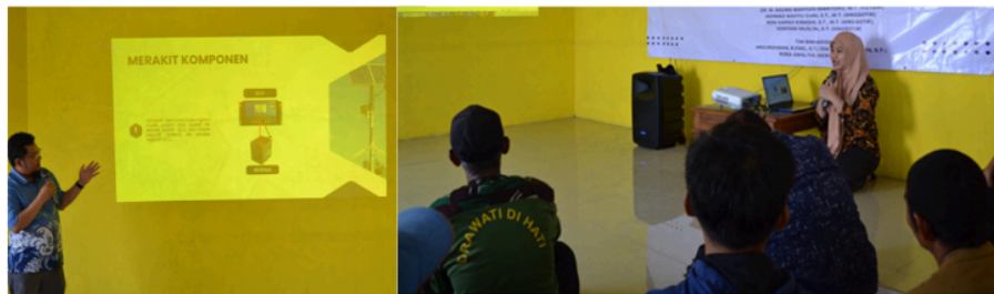
Gambar 2. Tim Menyampaikan Materi

Kegiatan pelatihan yang dilaksanakan secara langsung di ruang komunitas desa memberikan ruang pembelajaran yang inklusif. Metode ceramah interaktif dan simulasi instalasi terbukti sangat efektif dalam menjembatani kesenjangan antara teori dan praktik. Pelatihan berbasis praktik yang menggabungkan teori dan pengalaman langsung di lapangan terbukti lebih efektif daripada pendekatan pembelajaran semata. Sebagai contoh, program pelatihan Solar PV oleh RES4Africa Academy di Afrika dilengkapi dengan simulasi lapangan dan kegiatan praktikal, dan 42 % peserta menyatakan memperoleh peluang kerja baru pasca-pelatihan, menandakan keberhasilan aspek praktik dalam transfer teknologi 6 . Demikian pula, pelatihan GreenSkills4Dev di Mozambik yang mengintegrasikan penggunaan alat nyata seperti modul dan baterai meningkatkan kapabilitas peserta secara signifikan 7 .