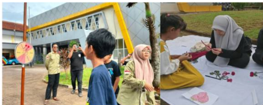
Gambar 4. Kegiatan Bermain Anak Panah dan kerajinan tangan

Kemudian peserta diarahkan ke stand selanjutnya yaitu stand permainan bola kardus. Pada stand ini menekankan pada koordinasi dan kerja sama tim. Tidak hanya itu, peserta juga diberikan ruang untuk mengekspresikan diri melalui aktivitas literasi ekspresif seperti membaca puisi, berbalas pantun, mendongeng, membaca cerpen, dan menunjukkan kemampuan bernyanyi. Pada stand ini peserta diajak bermain anak panah guna menentukan aktivitas literasi apa yang harus mereka lakukan. Hal itu menjadikan peserta lebih antusias dalam mengekspresikan diri.