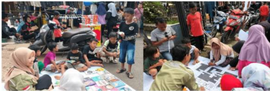
Gambar 2. Peserta Membaca dan Bermain Permainan Edukatif Teka-Teki Silang

Kegiatan Taman Literasi dimulai pada pukul 06.30 WIB dan berlangsung hingga pukul 10.00 WIB. Kegiatan ini dilaksanakan dengan menghadirkan berbagai aktivitas edukatif yang dikemas secara menarik dan interaktif. Panitia menata stand yang telah dirancang, setelah itu panitia mengajak pengunjung Car Free Day untuk berkunjung ke setiap stand dengan membagikan kupon permainan di Taman Literasi. Peserta pertama-tama diarahkan untuk mengunjungi stand UKM-F Literasi Pendidikan, di mana mereka diajak melihat dan membaca berbagai koleksi buku yang telah disediakan. Kegiatan ini bertujuan untuk menumbuhkan minat baca dan membiasakan peserta khususnya anak-anak dan remaja untuk berinteraksi dengan bahan bacaan dalam suasana yang menyenangkan.