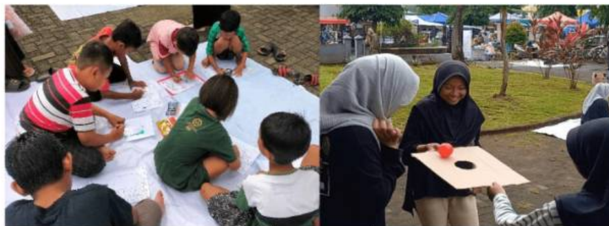
Gambar 3. Kegiatan Menggambar, Mewarnai dan Permainan Bola Kardus

Pada stand menggambar dan mewarnai yang memfasilitasi ekspresi visual dan kreativitas anak. Menggambar adalah salah satu gerbang menuju budaya literasi dalam keluarga, dengan menggambar dan mewarnai dapat melibatkan aspek keterampilan motorik anak dalam melatih koordinasi antara mata dengan tangan. Dilihat dari aspek kognitifnya kegiatan menggambar dan mewarnai menjadikan anak berpikir saat berimajinasi menuangkan idenya.