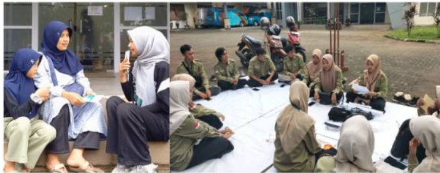
Gambar 5. Evaluasi dari Masyarakat dan Evaluasi Panitia

Kegiatan ini sudah cukup menarik, tetapi jika diselenggarakan dengan konsep yang lebih matang lagi dan struktur, dan panitia yang lebih banyak serta perlengkapan kegiatan yang memadai tentu kegiatan Taman Literasi dapat lebih berdampak lagi untuk masyarakat dan sekitarnya.