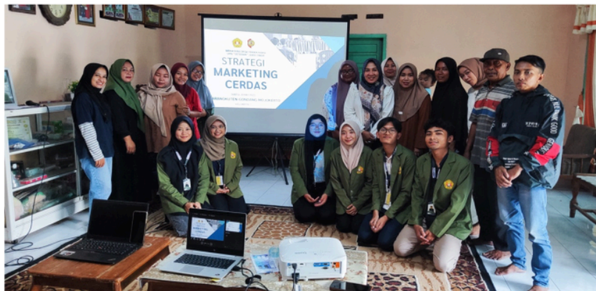
Gambar 1. Kegiatan Sosialisasi Strategi Marketing UMKM Desa Karangkuten

Guna mengetahui kondisi aktual dan kebutuhan pelaku UMKM dalam hal strategi pemasaran, dilakukan penyebaran kuisioner pada saat pelaksanaan sosialisasi. Hasil kuisioner menunjukkan bahwa sebagian besar pelaku UMKM masih memasarkan produk mereka secara langsung melalui kios, meskipun sebagian sudah mulai memanfaatkan media sosial seperti Facebook dan Whatsapp. Namun demikian, pemanfaatan media sosial tersebut masih belum optimal karena pelaku usaha belum sepenuhnya memahami strategi promosi digital yang efektif. Hal ini terlihat dari masih rendahnya intensitas promosi serta pengetahuan mengenai teknologi AI.